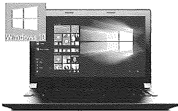
画像はWindows10のイメージです。当日多機種有り会場にて実物をご確認ください。